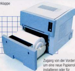
Zugang von der Vorderseite, um eine neue Papierrolle zu installieren oder für Wartungszwecke.