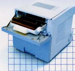
Um die Tintenpatrone zu wechseln, einfach Papierklappe nach vorne ziehen.

Der CHC-S9045 Digital Photo Printer kann in ein automatisches Verkaufssystem integriert oder als alleinstehender Desktop-Drucker verwendet werden. Indem er in nur 22 Sekunden hochqualitative Drucke mit exzellenten Speicherfähigkeiten bietet (Größe PC), eröffnet er Potential für neue Produkte, neue Dienste und neue Geschäfte.